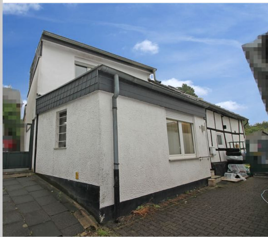
Fotos Hausansichten & Terrasse