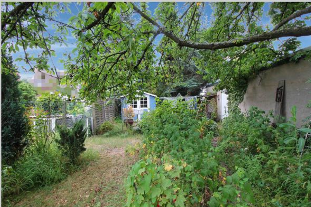
Hausansicht und Garten