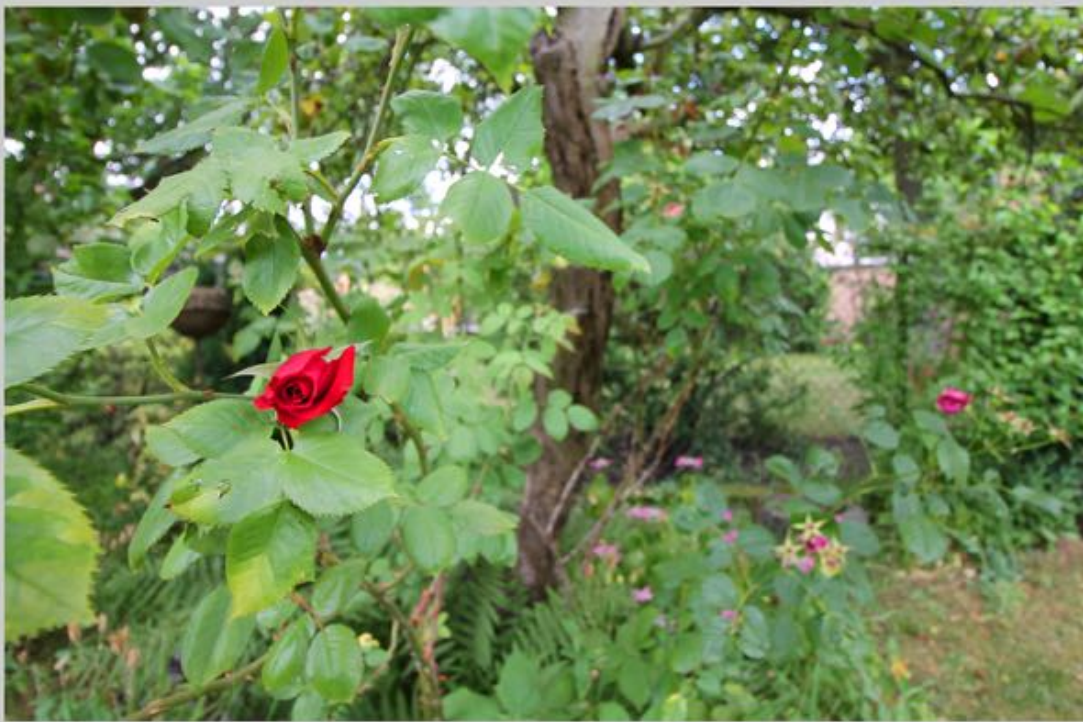
Terrasse & Detailansichten