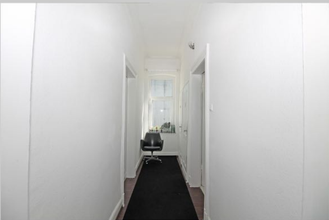
Hausansicht, Garten, Bad und Diele